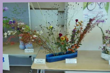
華道部の展示作品。 校内の雰囲気華やかに していました。↓