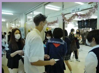
JETのテリー先生も 楽しんでいました。↓