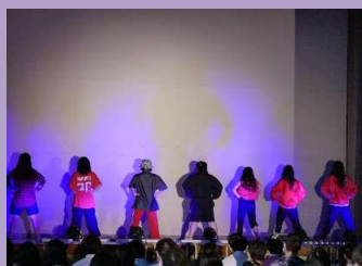
↑OPセレモニーの様子。 1、2年生は中継映像を 教室で視聴しました。