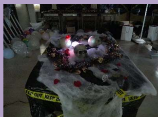
↑クラス企画のお化け屋敷。 内装や飾り付けにも こだわっていました。